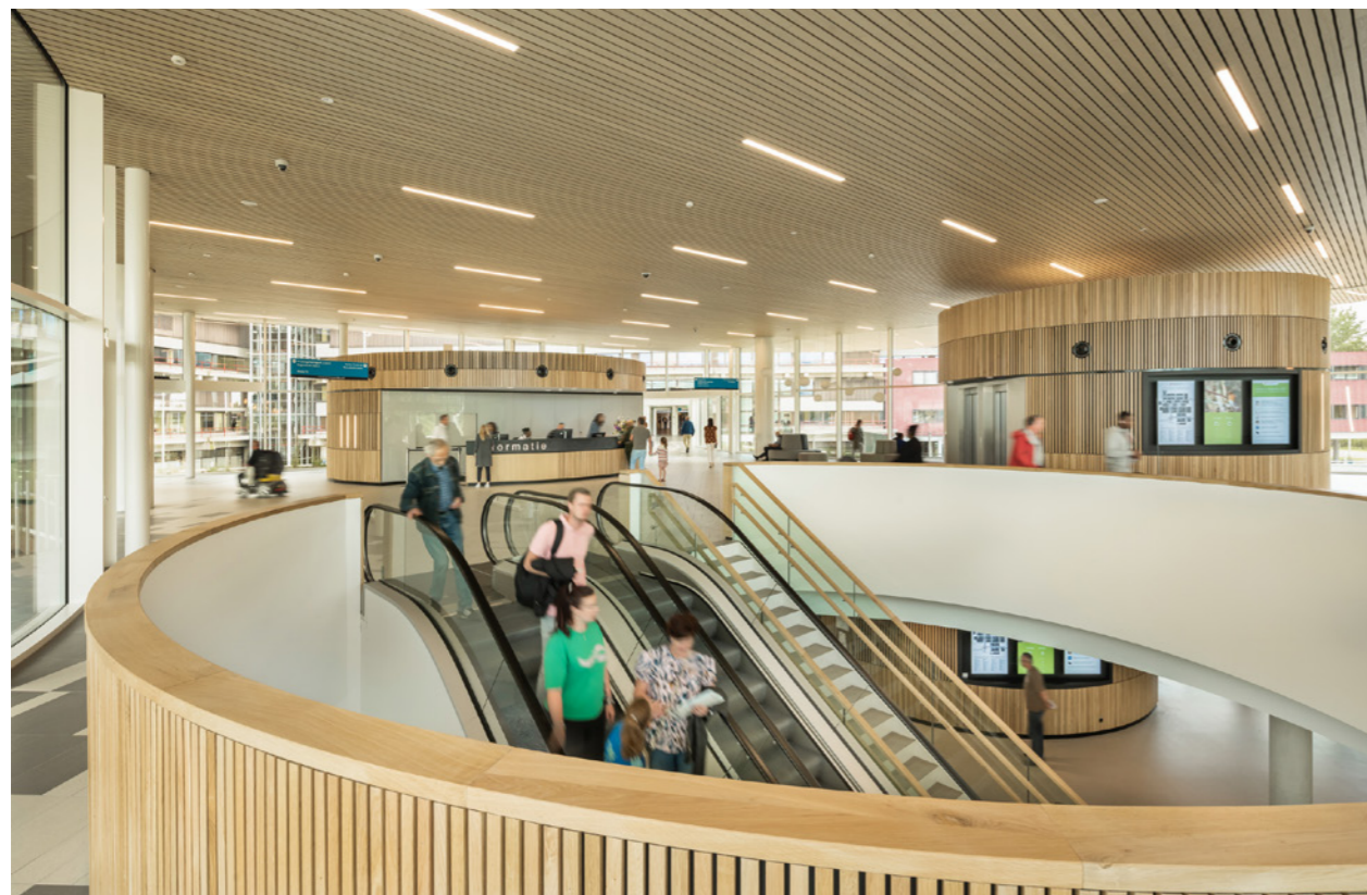
Gebogen lijnen en lichte materialen geven het entreepaviljoen een minder intimiderende indruk dan de ruwe stenen buitenkant van de monoliet.