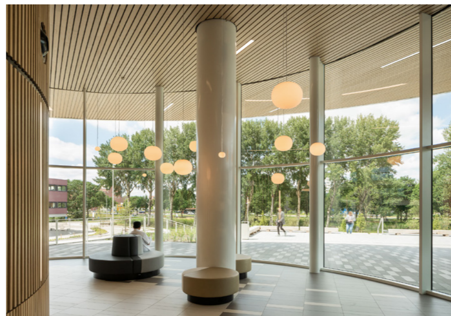
De ronde vormen leiden de bezoekers als vanzelf naar de informatiebalie en de twee hoofdingangen. Tussen deze ronde volumes en de gevel zijn zitplekken gemaakt vanwaar je zicht hebt op het prachtige groene park.