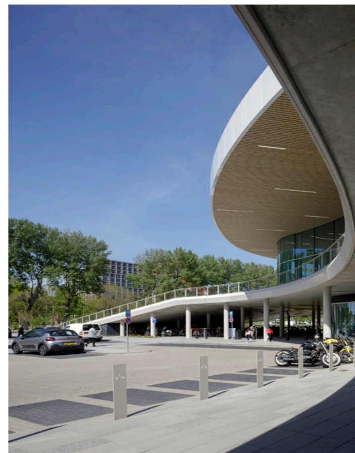
Het entreepaviljoen zichtbaar vanaf de Kiss&Ride, park en parkeerplaats