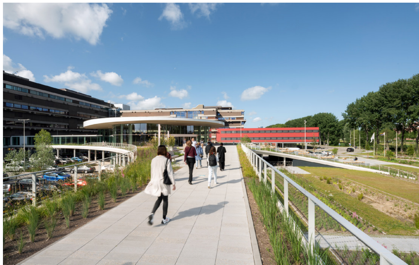
Het voetgangersdek is maximaal toegankelijk voor bezoekers en patiënten, ook voor diegenen met een handicap.