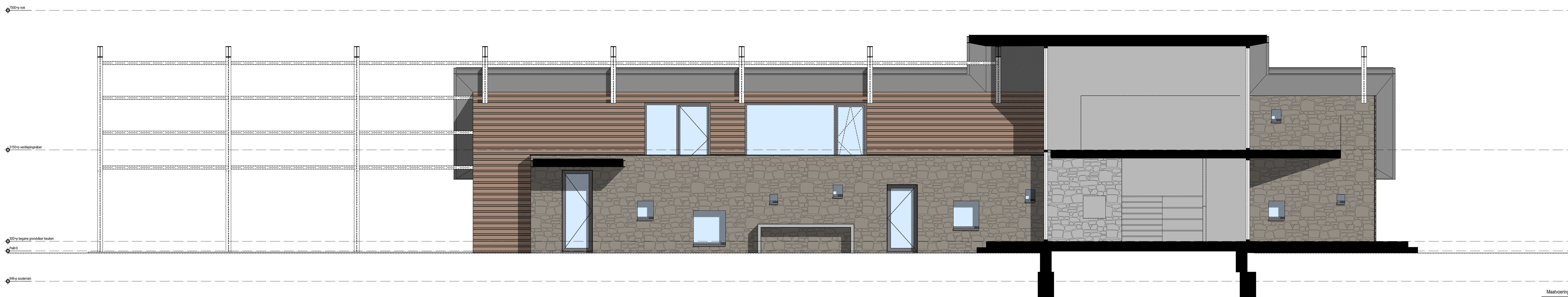
binnenplaats gevel atelier